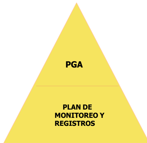
Figura 2: Estructura básica de la Gestión Ambiental de la obra

La estructura de instrumentos de gestión ambiental prevista para la obra es la siguiente