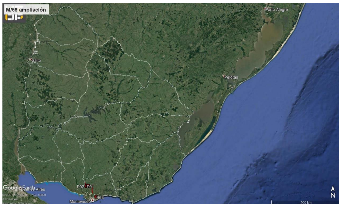
Ilustración 1 - Ubicación del contrato a nivel nacional.

La ampliación de contrato permitió ejecutar trabajos de obras mayores y de mantenimiento sobre las rutas 32 y 64. Al momento de la auditoría, las obras obligatorias del contrato básico se encontraban ejecutadas al 100%. Durante la auditoría recorrimos parcialmente la ruta 64, que fue el último frente de obra ejecutado con la ampliación de contrato. Pudimos observar que las obras obligatorias fueron culminadas y abandonadas siguiendo los lineamientos establecidos en el PRA en cuanto a los trabajos de recuperación de la faja pública y campamentos provisionales abandonados.