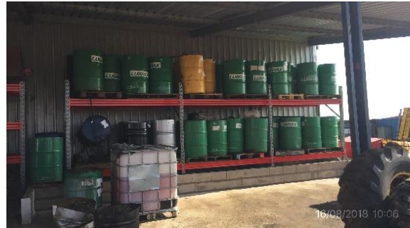
Ilustración 5 - Obrador CVC – Depósito de lubricantes