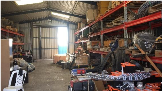
Ilustración 4 - Obrador CVC - Pañol.