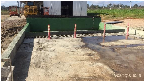
Ilustración 12 - Obrador CVC. Explanada de lavado con cámara sedimentadora