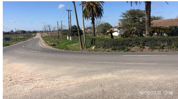
Ilustración 17 – P02, fin de tramo Ruta 64, empalme con caminería departamental, ciudad de Canelones.