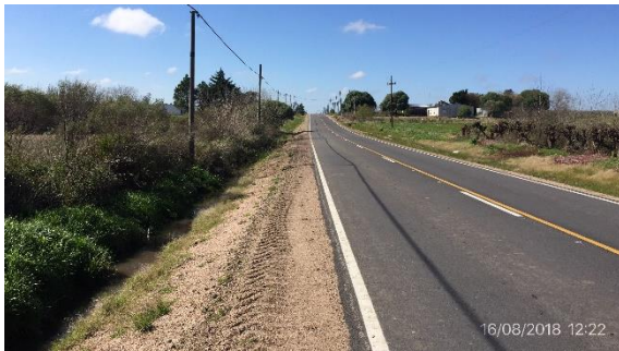
Ilustración 14 – Ruta 64, tramo recuperado.