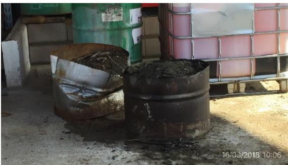
Ilustración 6 - Obrador CVC – acopio de áridos contaminados con lubricantes