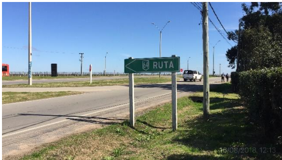
Ilustración 16 – P02, fin de tramo Ruta 64, empalme con caminería departamental, ciudad de Canelones