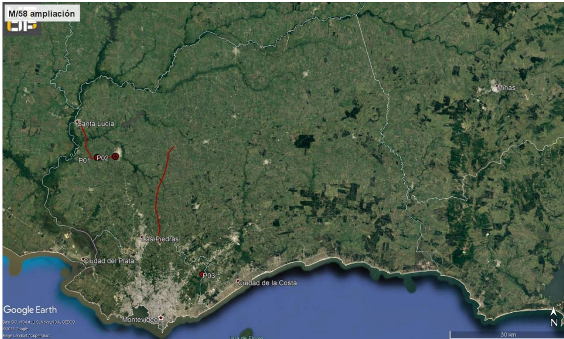
Ilustración 2 - Ubicación del contrato a nivel departamental.