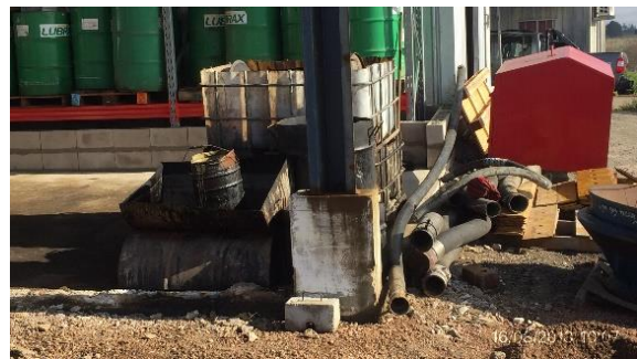
Ilustración 7 - Obrador CVC. Bandejas para trasiego de lubricantes.