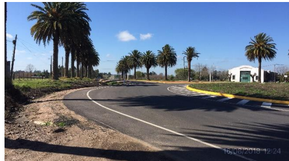
Ilustración 15 – P01, inicio de tramo Ruta 64 empalme con Ruta 46