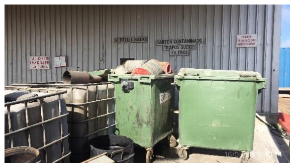
Ilustración 11 - Obrador CVC. Acopio de filtros contaminados con lubricantes