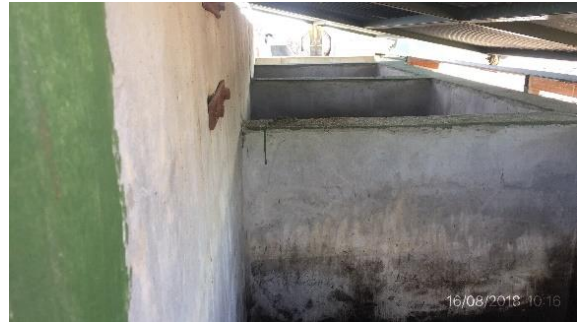
Ilustración 13 - Obrador CVC. Cámara sedimentadora