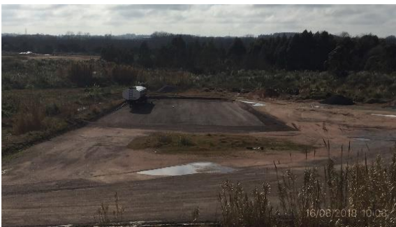
Ilustración 8 – Obrador CVC - Explanada acondicionada para acopio de emulsiones asfálticas