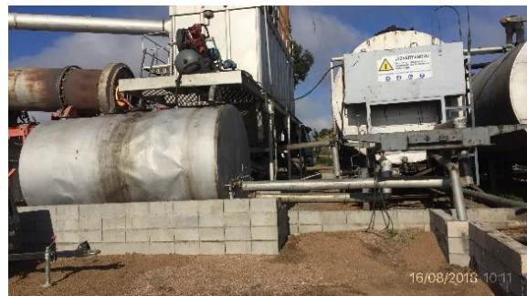
Ilustración 9 - Obrador CVC – planta asfáltica con envallado perimetral