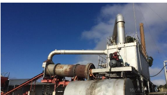
Ilustración 10 - Planta asfáltica CVC con filtro de mangas