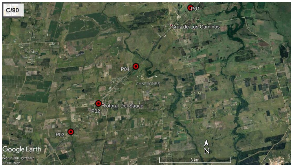
Ilustración 3 – P01, P02 y P03 Puntos auditados en alcantarillas. P04 empalme Rutas 7 y 75.