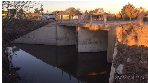
Ilustración 7 – Frente de obra – Alcantarilla H en Ruta 7 progresiva 35K400