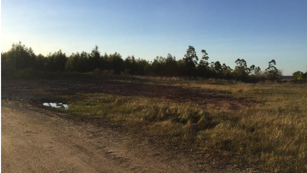
Ilustración 4 – Frente de obra – Acopio provisorio de áridos en faja de Ruta 7 autorizado por DDO.