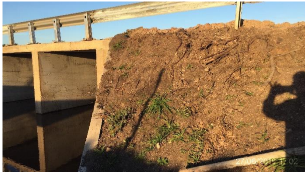
Ilustración 6 – Frente de obra – cabezal de alcantarilla H en Ruta 7 progresiva 41K000