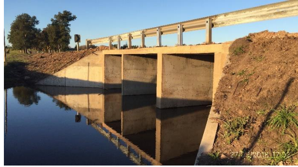
Ilustración 5 – Frente de obra – Alcantarilla H en Ruta 7 progresiva 41K000