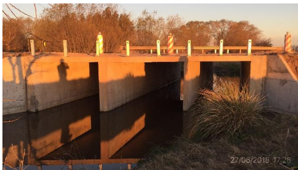
Ilustración 8 – Frente de obra – Alcantarilla H en Ruta 7 progresiva 33K700