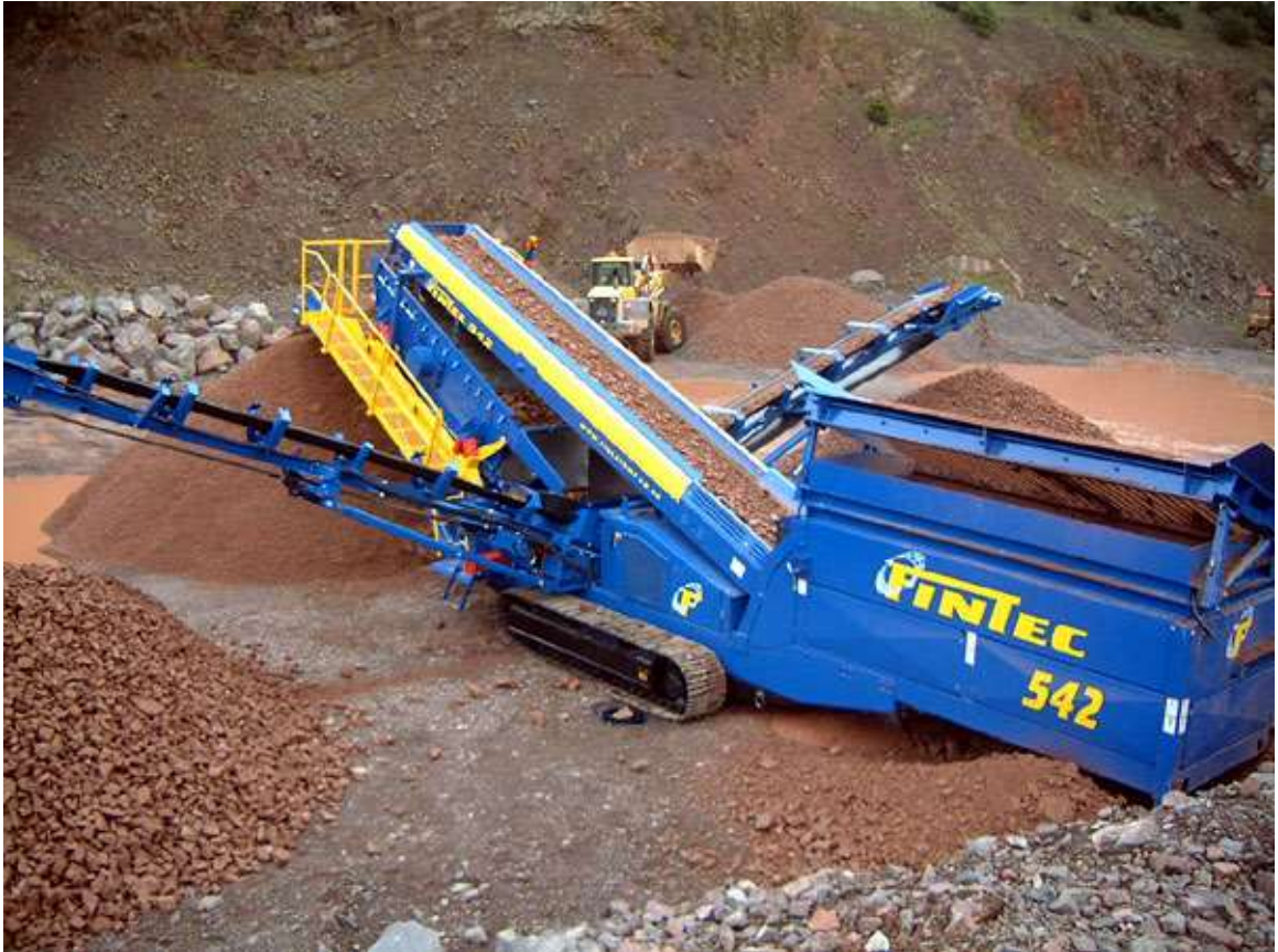
Figura 5: Vista de clasificación por zarandeo con FINTEC 542