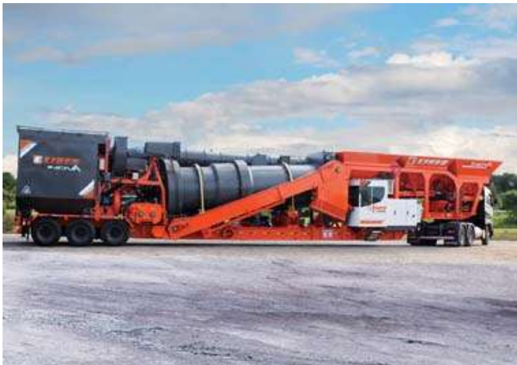
Figura 10: Transporte de planta asfáltica CIBER INOVA 1200-P1