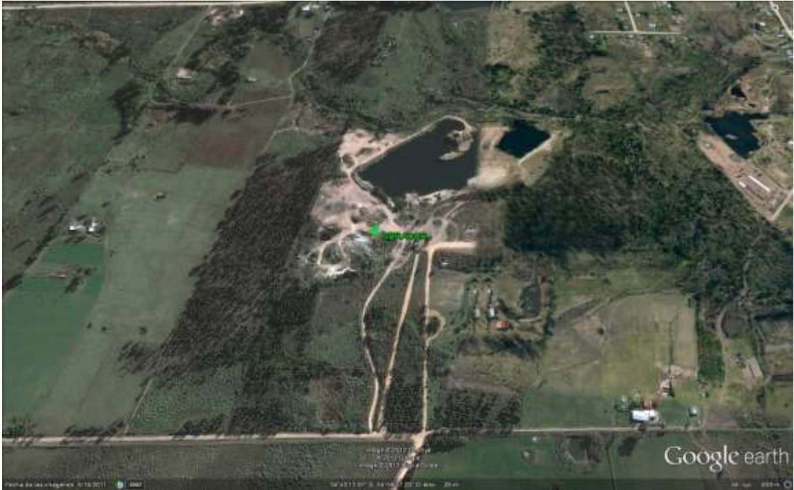
Figura 11: Vista de la cantera y obrador