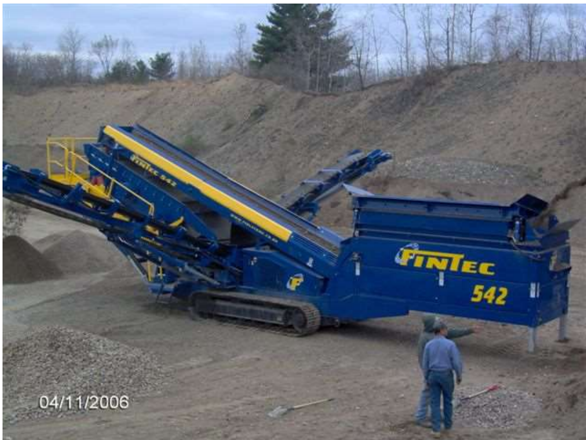
Figura 4: Vista de clasificación por zarandeo con FINTEC 542