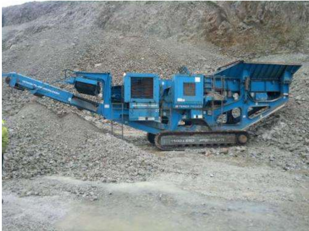
Figura 7: Vista de trituradora TEREX PEGSON 1100 x 650