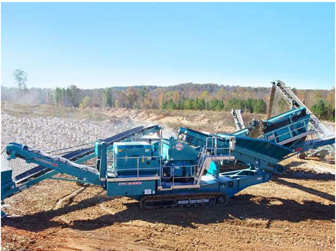
Figura 6: Vista de trituradora MAXTRAK 100SR