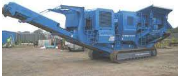
Figura 8: Vista de trituradora TEREX PEGSON 1100 x 650