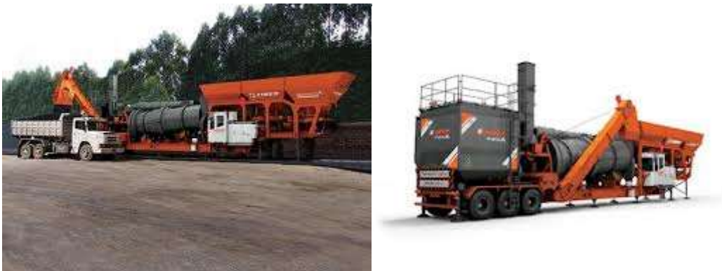
Figura 9: Vistas de planta asfáltica CIBER INOVA 1200-P1

En la planta asfáltica son utilizados los 3 áridos generados por la planta trituradora y arena. El área donde estará ubicada la planta asfáltica es aproximadamente de 1.500 m 2 , sobre una superficie de tosca previamente nivelada.