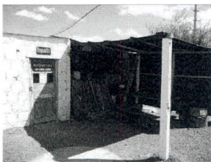
vista exterior depósito

algunos materiales de trabajo como señales, columnas, etc.. Se mantuvo el sistema implementado desde comienzo del contrato en lo concerniente al almacenamiento transitorio de residuos clasificados por tipo, bandejas para contener eventuales derrames que pudieran surgir de la manipulación de combustibles y aceites, extintores, señalización para situaciones de contingencia, etiquetado de los productos que se manejan en el lugar, fichas de seguridad para las distintas sustancias que se manejan, etc.. En el último trimestre no registraron eventos ambientales significativos.