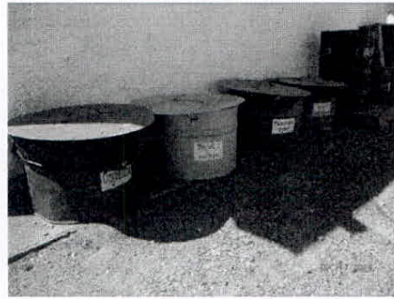
almacenamiento de residuos en Mariscal

Los residuos se concentran, clasifican y almacenan en recipientes debidamente tapados y rotulados, en el depósito de mantenimiento ubicado junto al galpón de Mariscal. Los residuos del tipo domésticos son trasladados a vertedero municipal de Mariscal, para lo cual se gestionó autorización en la IML (no se dispone de registros por la falta de personal en el mencionado predio). Los residuos especiales son trasladados al depósito central de la empresa, en la localidad de Juan Soler, donde se disponen según el siguiente criterio: arena contaminada, filtros usados y residuos contaminados (estopa, trapos, guates, envases) se entregan a TRIEX; envases plásticos de pintura se entregan a LUSOL; tanques de emulsión y todo tipo de chatarra se entregan a LAISA; aceites recuperados se entregan a PETROMOVIL; cubiertas usadas se entregan al proveedor o en el vertedero municipal de San José; baterías usadas se entregan al proveedor. En el último trimestre se mantuvo en funcionamiento este sistema de gestión de residuos sin eventos relevantes, estando disponibles los registros en el galpón de Mariscal.