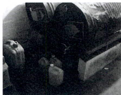
sistema de bandejas con arena para evitar derrames