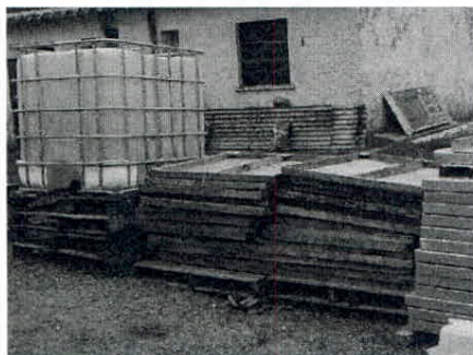
materiales (en uso) en el exterior del depósito