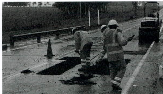
personal realizando tareas de bacheo

El personal estable del contrato son nueve personas, oriundas de Mariscal y Varela, que periódicamente es reforzado por otro personal para realizar tareas específicas como bacheo mayor, tratamientos, señalización horizontal, etc.. Todos cuentan con uniforme, zapatos de trabajo, chaleco reflectivo, casco, guantes, tapones u orejeras, y mascarillas según corresponde. En el último trimestre se cumplió con la revisión de elementos de seguridad prevista en el SIG.