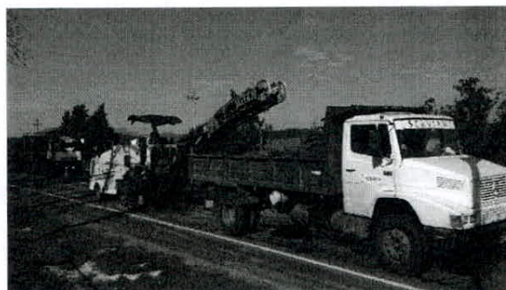
maquina y personal realizando trabajos de fresado

Las máquinas que actualmente trabajan en el contrato son cuatro tractores con pasteras, seis desmalezadoras, una combinada, un compactador liso liviano, una selladora de grietas y dos camioncitos. Circunstancialmente la plantilla de equipos se ve incrementada por la presencia de otras máquinas para realizar trabajos extraordinarios de mantenimiento (máquina pintadora y fresadora). Todos los equipos son de propiedad de la empresa. Todos cuentan con una ficha donde se registran las cargas de combustible, los cambios de aceites, las reparaciones y cualquier otra tarea de mantenimiento realizada. Esta documentación está disponible para su verificación en la propia máquina. Todos los grupos de máquinas cuentan con al menos un botiquín, un extintor contra incendios y un listado con los teléfonos de emergencia. Todos los camiones cuentan con certificado de SUCTA al día y sin observaciones en el capítulo 8. En el último trimestre no registraron eventos ambientales significativos.