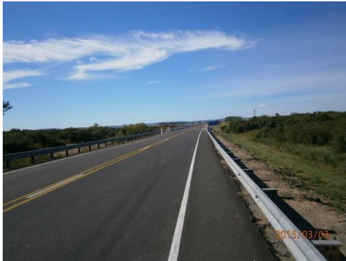
Ilustración 11-Vista de la obra desde el final del puente