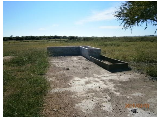
Ilustración 6-Pileta de lavado de camiones y mixer