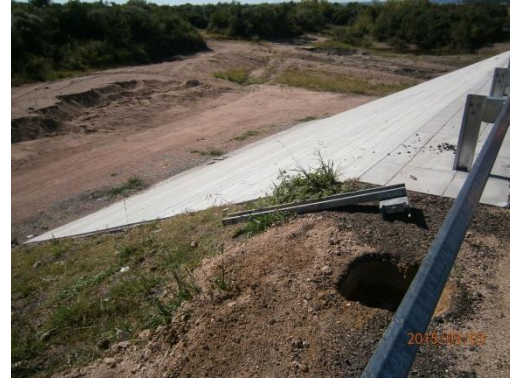
Ilustración 10-Para finalizar la obra, resta colocar algunas barandas