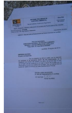
Ilustración 12-Petición de Policía Caminera para mantener las superficies de hormigón y la pileta de curado