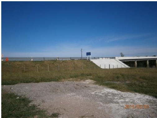
Ilustración 5-Otra superficie de hormigón presente en el predio. Verificar si está incluida en la petición de Policía Caminera