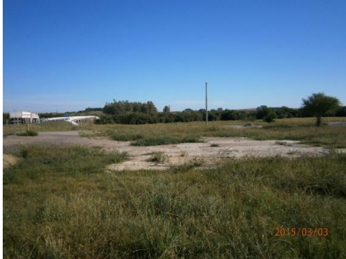
Ilustración 3- Superficie de hormigón de las antiguas oficinas