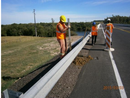
Ilustración 9-Frente de obra. Colocación de las nuevas barandas