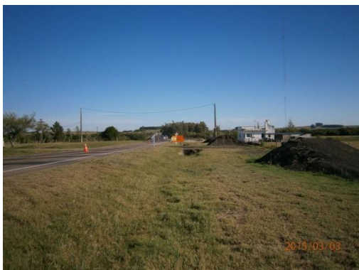
Ilustración 7-Presencia de acopios que pertenecen a otro contrato de mantenimiento de la ruta