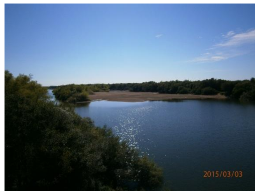
Ilustración 8-Vista de Río Cebollatí desde el puente