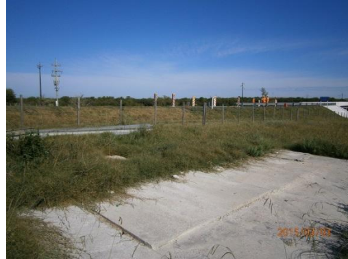
Ilustración 4 – Superficie de hormigón de las antiguas oficinas. Se ve el pozo a desagotar