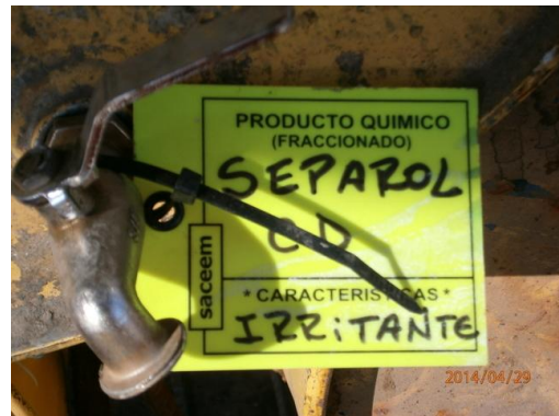
Ilustración 7-Sistema de etiquetado de sustancias químicas