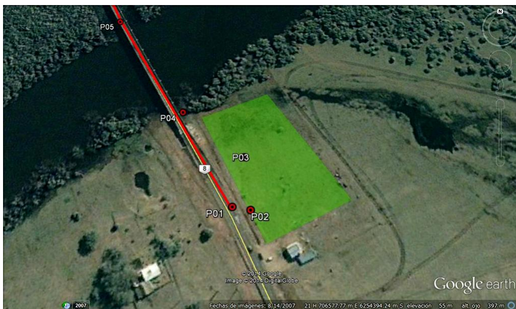
Ilustración 3- P01 Inicio del contrato, P02 Obrador, P03 Pileta lavado camiones con mixer