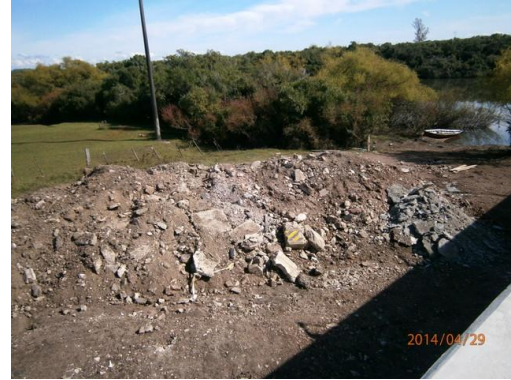
Ilustración 11-Escobros y movimiento de tierra en frente de obra