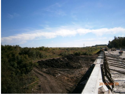
Ilustración 10-Movimiento de tierra en frente de obra