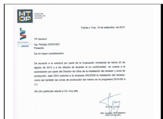
Ilustración 15-Autorización DDO para la instalación del obrador y acopios