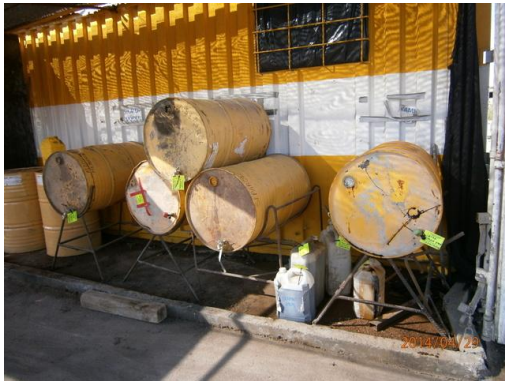
Ilustración 4-Almacenamiento de desmoldante, fluidizante y puente de adherencia