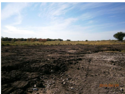
Ilustración 14-Terreno restaurado en el campamento