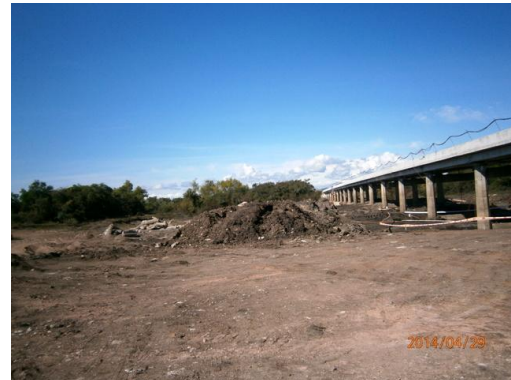
Ilustración 13-Movimiento de tierra en frente de obra