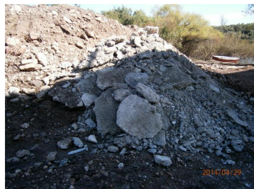
Ilustración 9-Escombros próximos al frente de obra