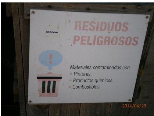
Ilustración 8-Sistema de clasificación de residuos