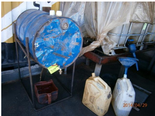
Ilustración 6-Almacenamiento de combustibles