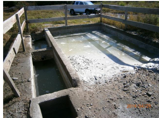
Ilustración 5-Pileta de lavado de camiones y mixer