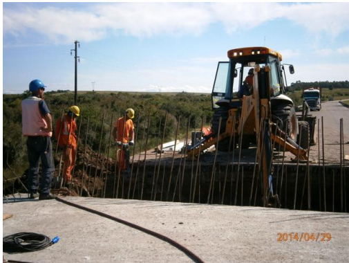
Ilustración 12-Trabajos en losa de acceso, frente de obra