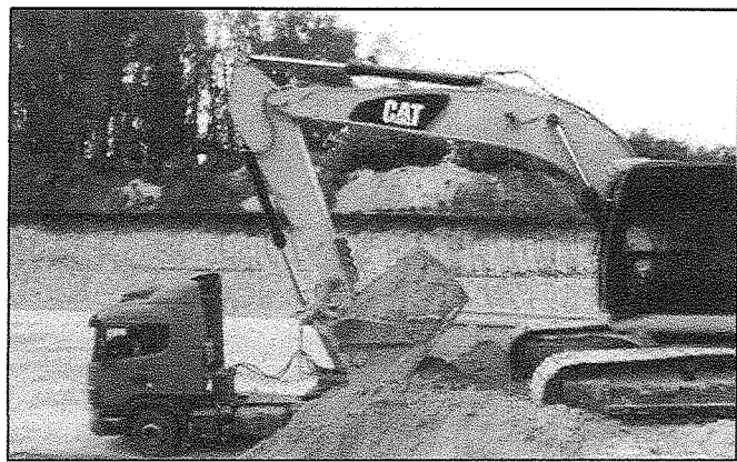
Extracción de material granular.