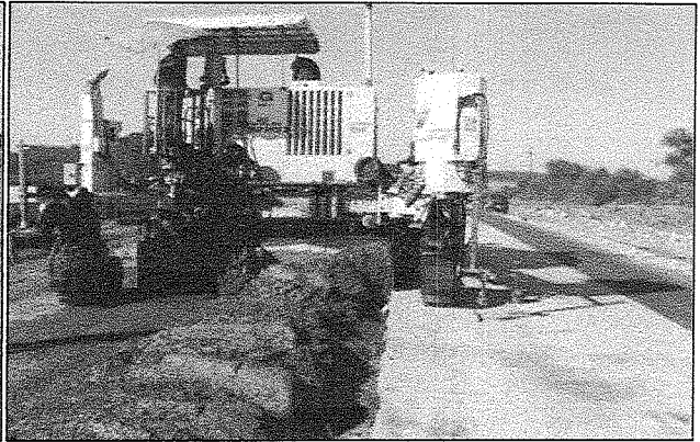
Extendido de hormigón en el km 33 (abril 2013).