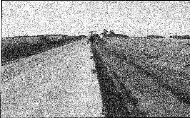
Preparación de superficie para extendido de hormigón en el km 26 (mayo 2013).