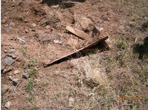
Ilustración 15-Cámara séptica parcialmente tapada