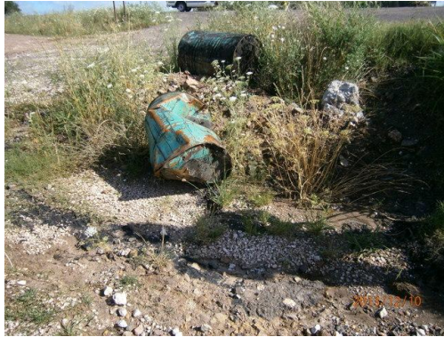
Ilustración 3-Derrame de asfalto y contenedor en faja pública, prog. 68K500