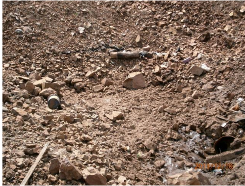
Ilustración 9-Algunos residuos en cantera de piedra, prog 141K000 a (-)