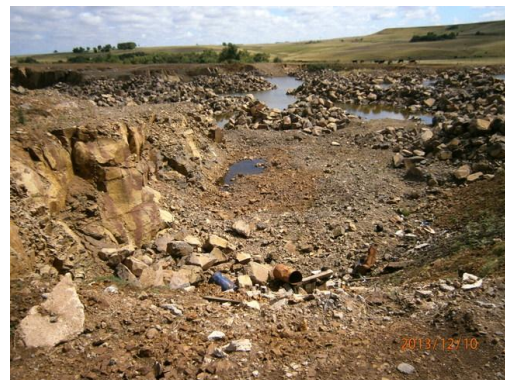
Ilustración 8-Algunos residuos en cantera de piedra, prog 141K000 a (-)