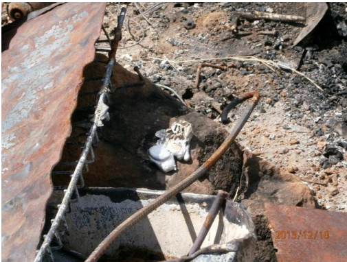
Ilustración 17-Residuos quemados en obrador y presencia de plomo