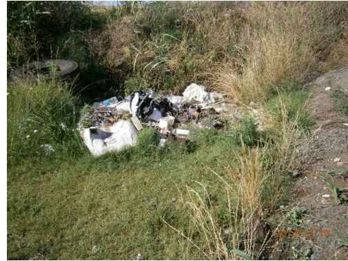
Ilustración 4-Residuos en faja pública, prog. 68K500