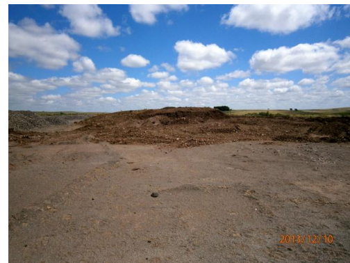
Ilustración 14-Acopio de corteza vegetal en obrador