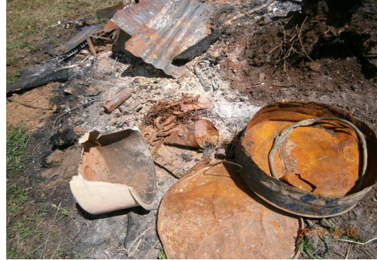
Ilustración 16-Residuos quemados en obrador