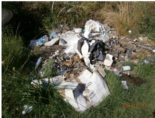
Ilustración 5-Residuos en faja pública, prog. 68K500