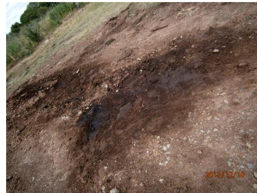
Ilustración 12-Mancha de hidrocarburos en obrador