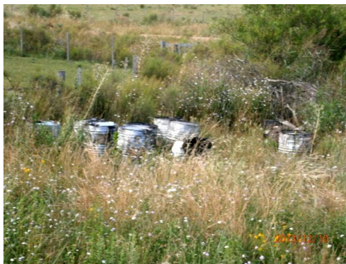
Ilustración 7-Contenedores en faja pública, prog. 68K500