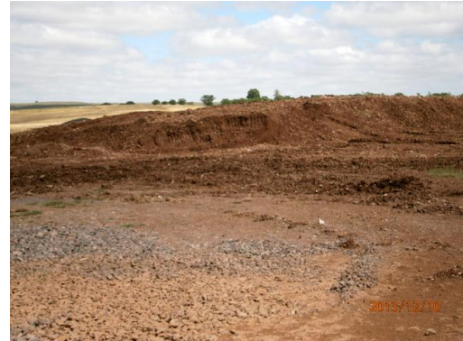
Ilustración 10-Cantera de piedra, prog 141K000 a (-)