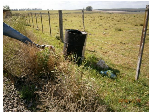
Ilustración 6-Restos de asfalto y contenedor en faja pública, prog. 68K500