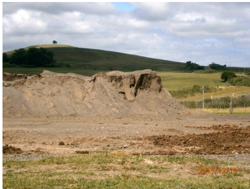
Ilustración 11-Acopios en obrador