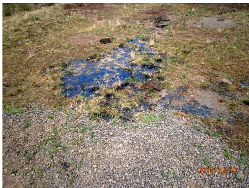
Ilustración 13-Mancha de hidrocarburos en obrador