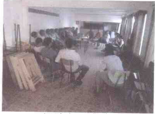
jornada de capacitación