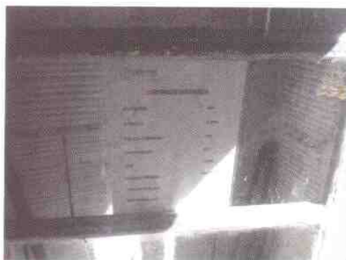
teléfonos de emergencia