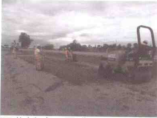
personal trabajando con su uniforme y elem. de seguridad