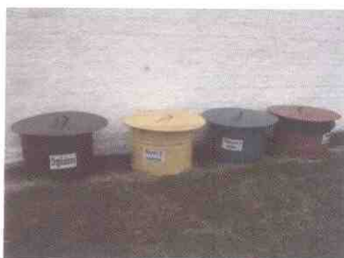
deposito de residuos en el depósito de Mariscal

Dirección: Treinta y Tres 413 – San José, Uruguay Teléfono: (00598) (434) 29371 – (00598) (434) 29003 Fax: (00598) (434) 29763 Email: administracion@serviam.com.uy