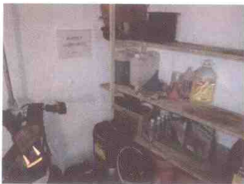
depósito de repuestos y materiales