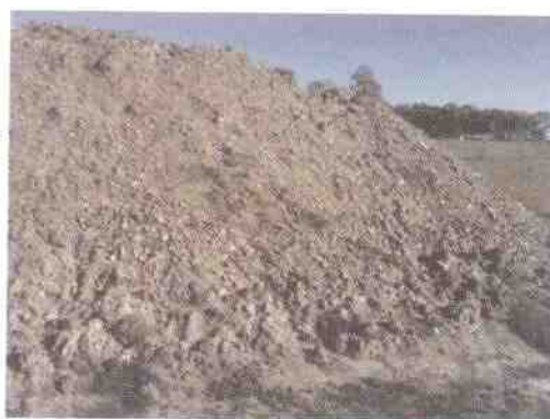
acopio de suelo orgánico