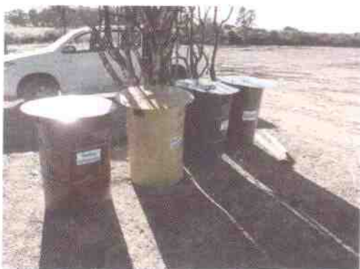
depósito de residuos en el obrador del km 237

Los residuos generados en el obrador o el frente de mantenimiento se concentran, clasifican y almacenan en depósitos debidamente rotulados en dos lugares, uno junto a la portera de acceso al obrador y otro en el lateral del depósito de mantenimiento. Los residuos del tipo domésticos son trasladados a vertedero municipal de Mariscal (no hay registros por la falta de personal municipal en el mencionado predio). Los residuos del tipo contaminados son trasladados al depósito central de la empresa en la localidad de Juan Soler donde se disponen según la normativa vigente (se adjuntan registros de entrega).