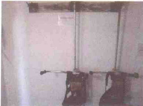
depósito de herramientas y elementos de seguridad