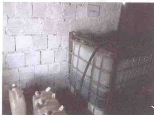
depósitos de combustible con bandeja para derrames