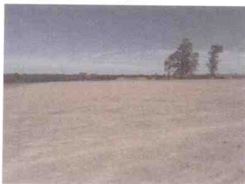
plataforma para las plantas

La previsión es utilizar plantas (trituradora y asfáltica) totalmente móviles, montar las oficinas, depósitos y laboratorios en contenedores, y construir el comedor y los baños (con su correspondiente pozo negro) con materiales fácilmente desmontables.