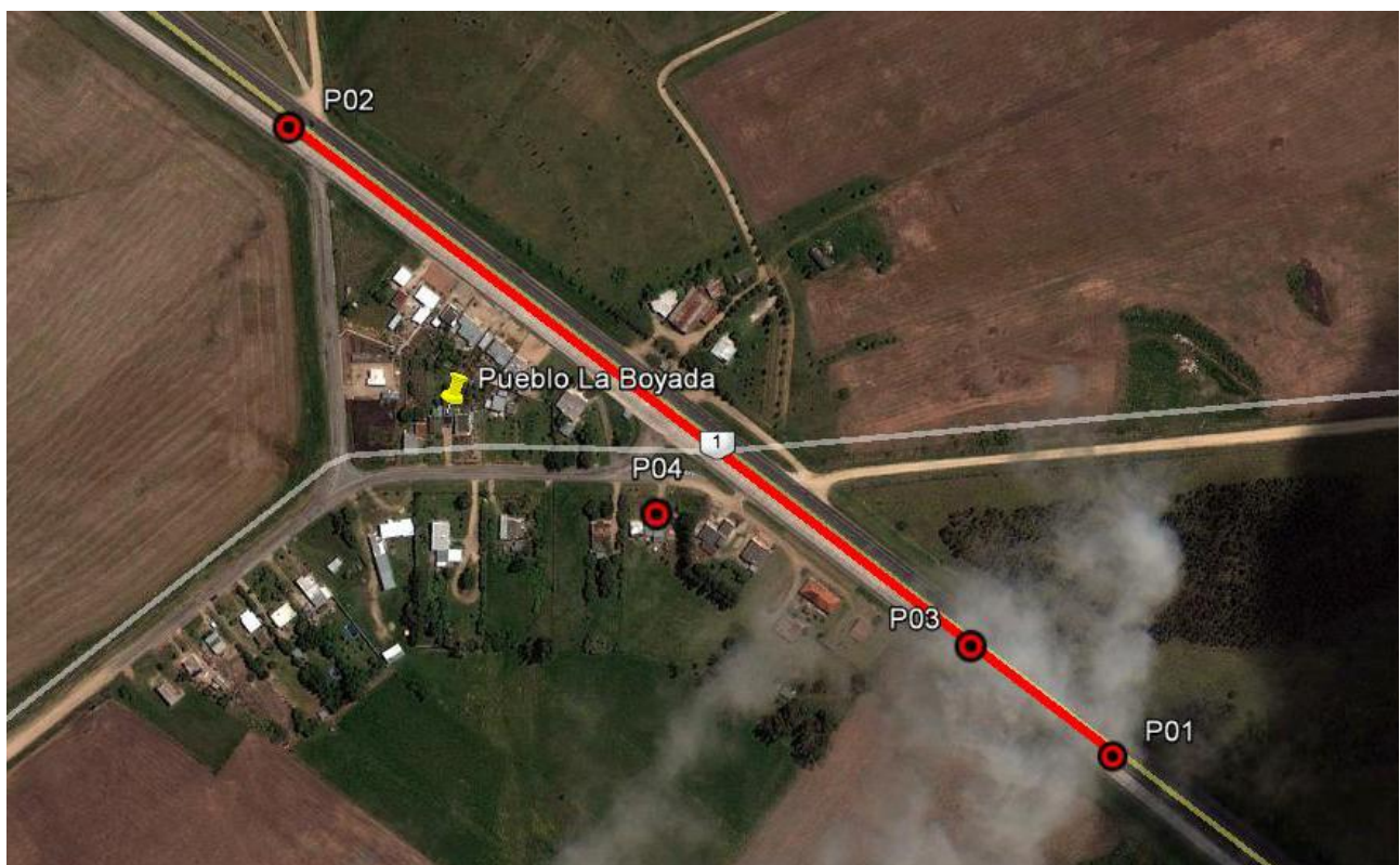
Ilustración 2: Detalle de ubicación de puntos destacados en Pueblo La Boyada.