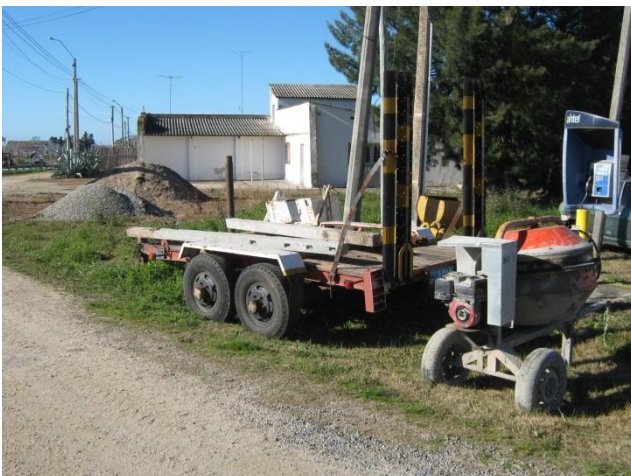
Ilustración 7: Acopio de materiales en Campamento