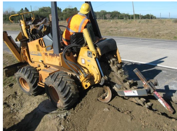
Ilustración 6: Máquina zanjadora