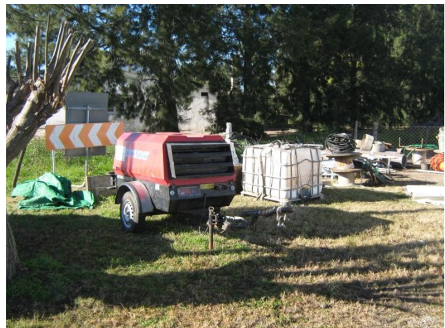
Ilustración 8: Acopio de materiales en Campamento