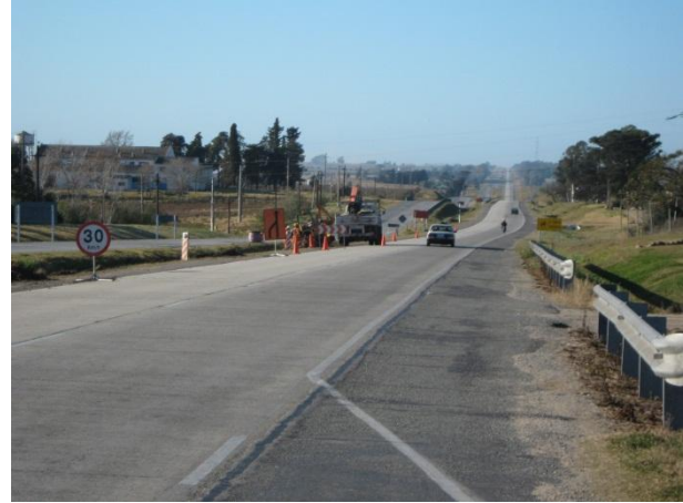
Ilustración 4: Señalización de frente de obra