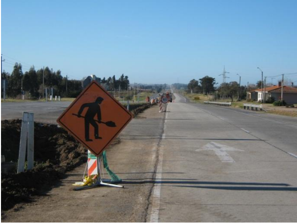
Ilustración 3: Señalización de frente de obra