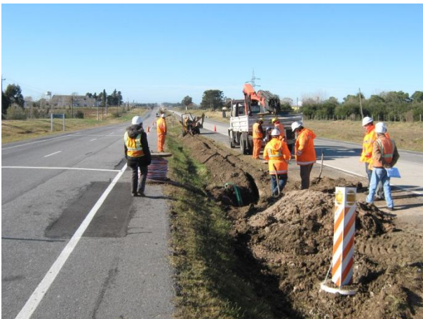
Ilustración 5: Frente de Obra en Pueblo La Boyada