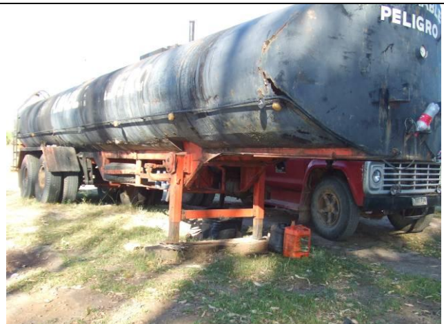
Ilustración 11 - Tanque de asfalto sin contención