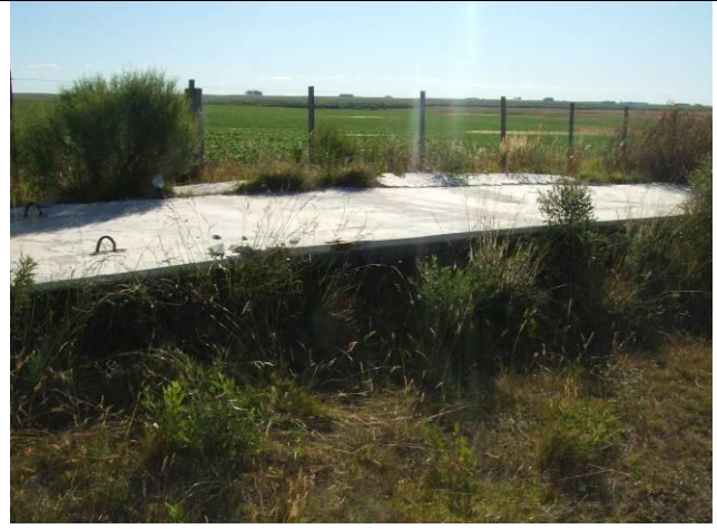
Ilustración 3 - Estructura de hormigón