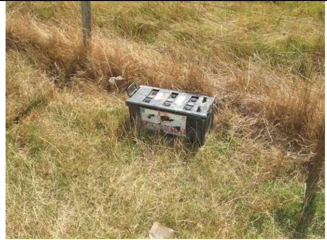
Ilustración 15 - Batería en uso sobre terreno sin pileta de contención