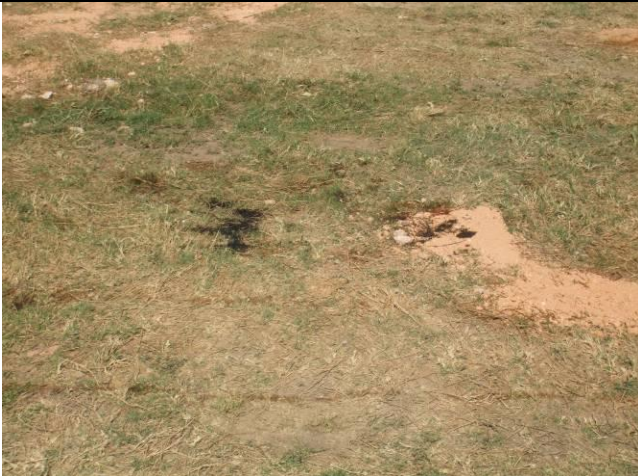
Ilustración 14 - Derrame de hidrocarburo