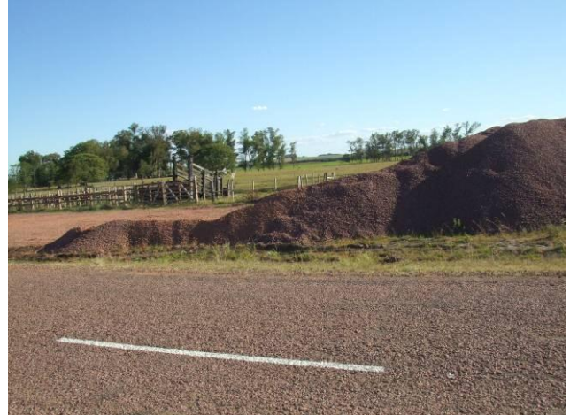
Ilustración 7 - Acopio de materiales al costado de la ruta