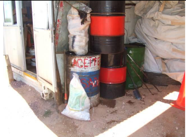
Ilustración 13 - Depósito de aceite usado sin contención