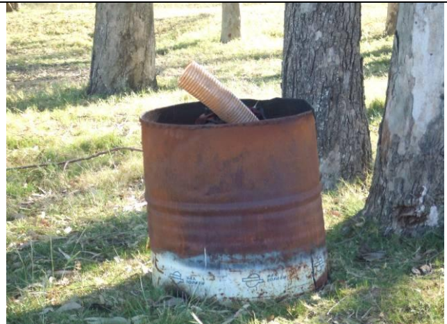
Ilustración 9 - Recipiente sin identificación