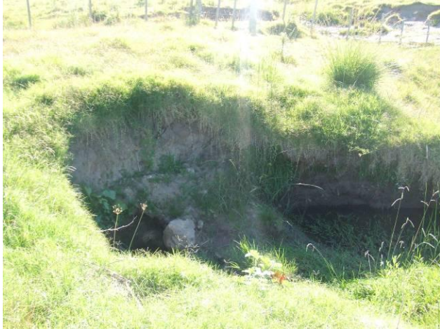
Ilustración 6 -Residuos de frente de obra