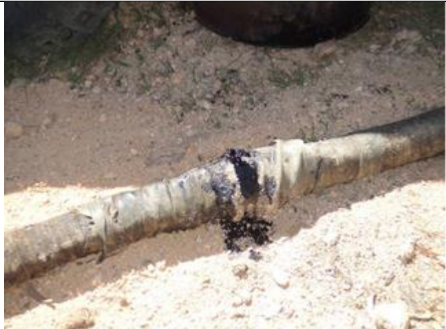
Ilustración 21 – Manguera para trasvase con pérdidas