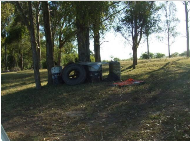
Ilustración 8 – Cubiertas y residuos