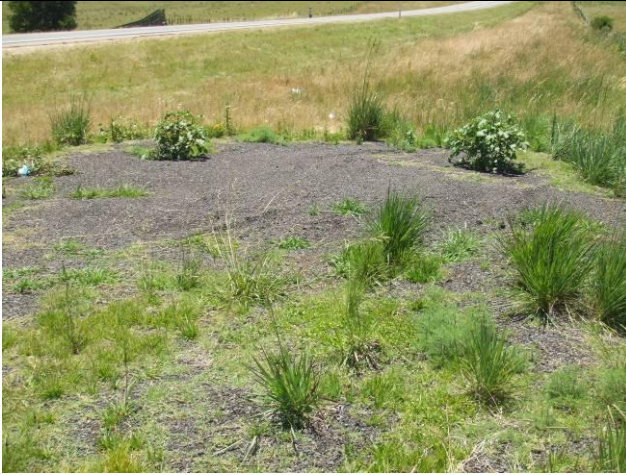
Ilustración 2 - Restos de asfalto