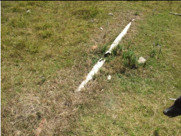
Ilustración 12 - Tubo de conexión de pozo negro con rotura