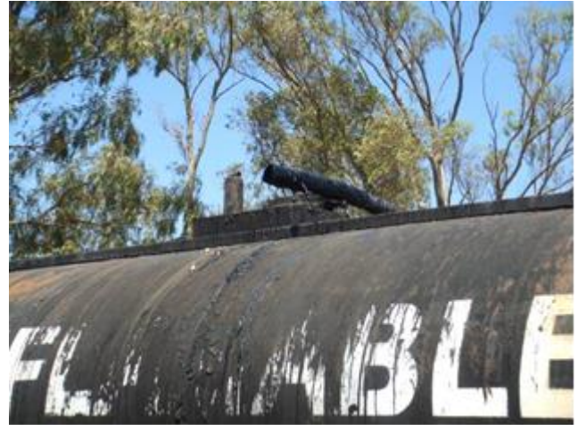
Ilustración 19 – Depósito de asfalto en mal estado