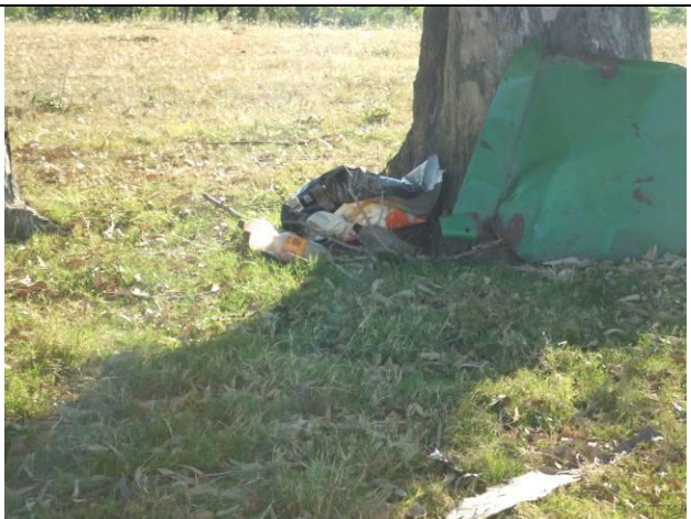
Ilustración 10 - Residuos sin recipiente