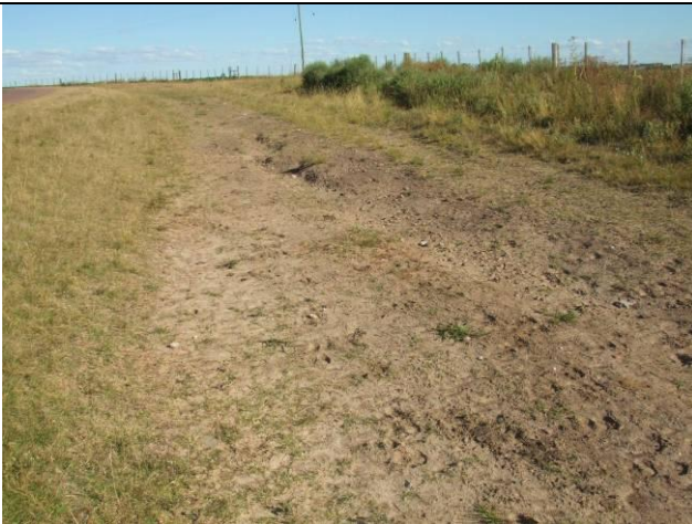
Ilustración 4 - Costado erosionado sin cobertura