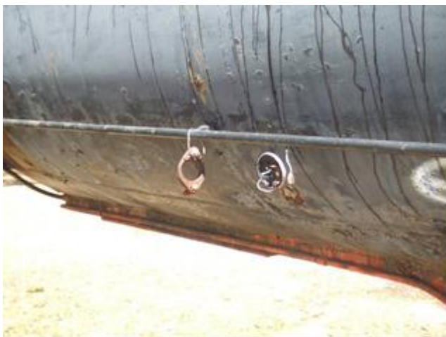
Ilustración 20 – Depósito de asfalto en mal estado