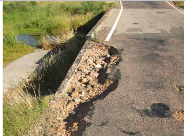
Ilustración 5 - Puente sin mantenimiento y erosión