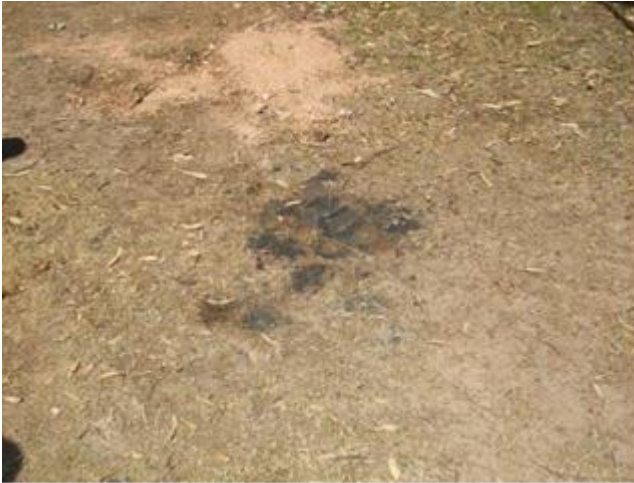
Ilustración 18 – Derrame de emulsión asfáltica en estacionamiento de maquinaria