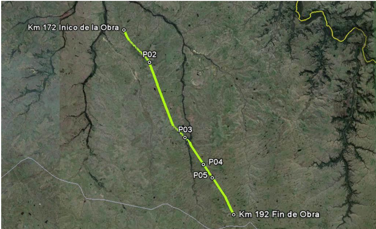
Ilustración 2 - Puntos destacados