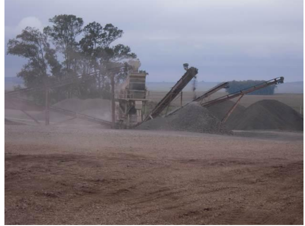
Ilustración 10 - Planta trituradora