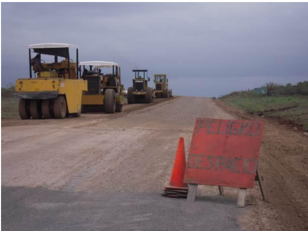
Ilustración 5 - Inicio Frente de Obra