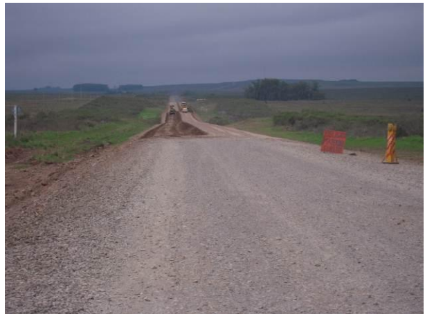
Ilustración 6 - Fin de Frente de Obra