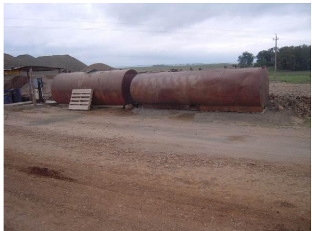
Ilustración 8 - tanques de combustible sin contención ante derrames