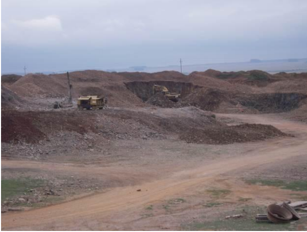
Ilustración 9 - Cantera de balastro