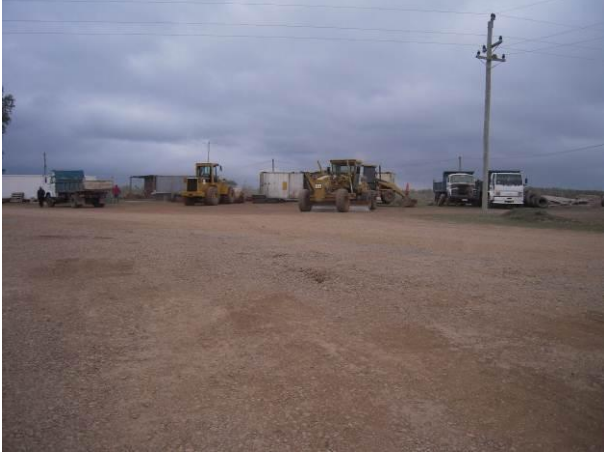
Ilustración 4 - Obrador