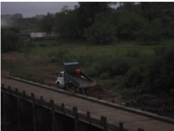
Ilustración 7 - Lavado de camión- Ao Catalán Gde.